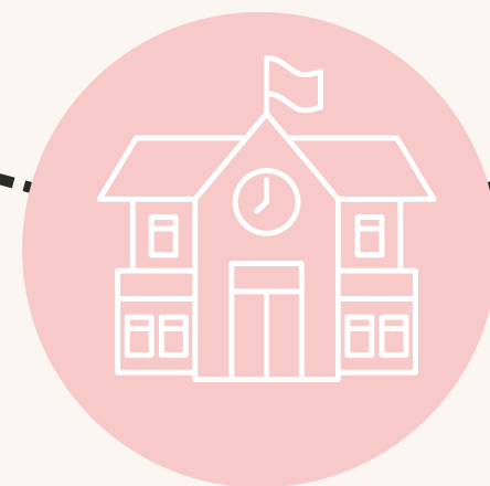
Instituții / Școală